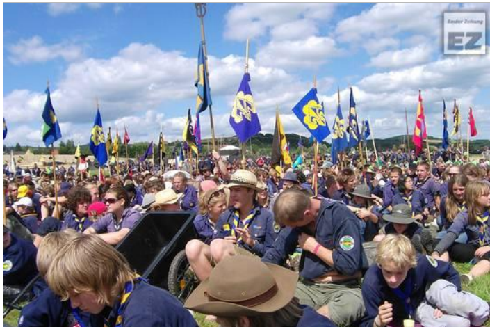
4500 Pfadfinder unter sich: beim Bundeslager im nordhessischen Immenhausen erleben die Mitglieder den Alltag fern vom Luxus.

Der Pfadfinderstamm der Manninga hat seine Zelte im Bundeslager im hessischen Immenhausen aufgeschlagen. Er ist mit insgesamt elf Pewsomern vertreten.