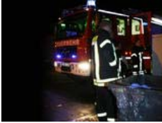
Ursachenforschung: Müllcontainer brannten