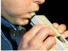
Rollerfahrer betrunken - Zeugin passte auf