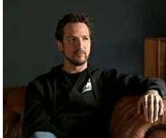
Frank Turner: Positive Lieder für negative Menschen