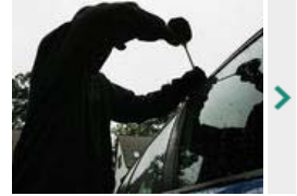
Polizei schnappt zwei Autoknacker