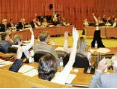
Region: Wolfsburg will mehr mitreden