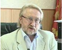
HI-Virus breitet sich in Russland rasant aus