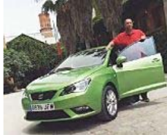
Fahrbericht: Seat Ibiza stylish, sparsam, gut vern...