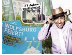
77. Stadtgeburtstag: Das Programm zur Party